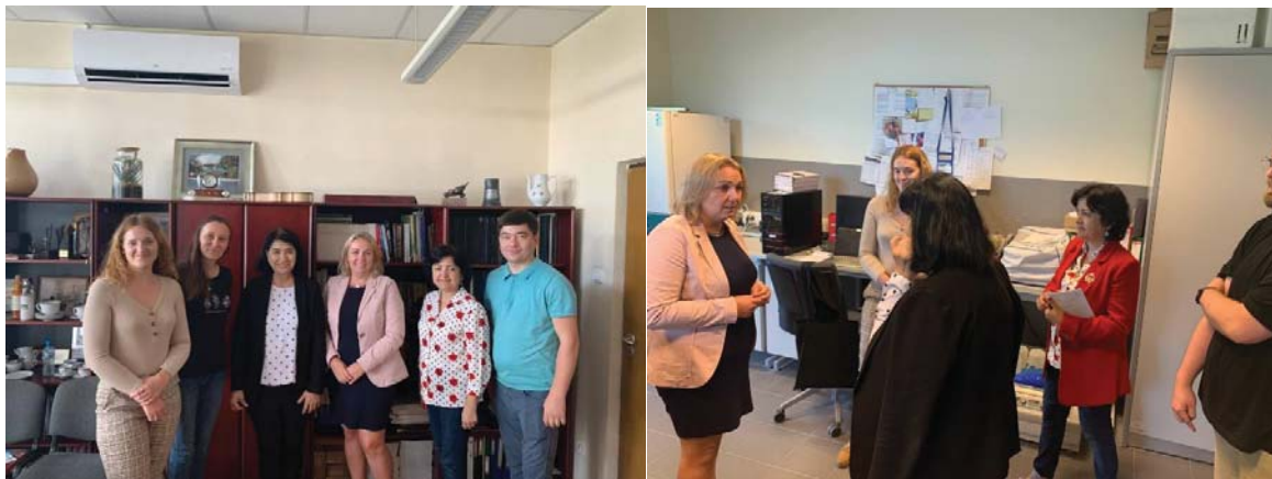
Встреча с сотрудниками научной группы по биокерамике.