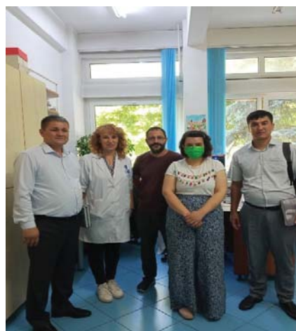
Trening jarayonlaridan lavhalar