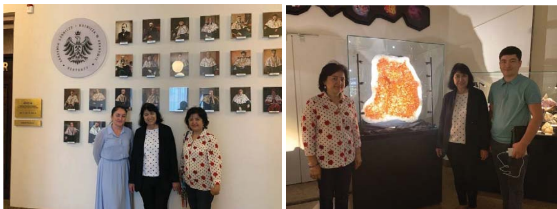
Посещение геологического музея АГН, 05.07.2022 г.

Сотрудники Международного отдела университета АГН ознакомили преподавателей из Ташкента с историей университета, провели экскурсии по факультетам, библиотекам и музеям университета, а также организовали экскурсию по геологическому музею университета, содержащему уникальные самородные драгоценные и полудрагоценные минералы, камни и самоцветы.