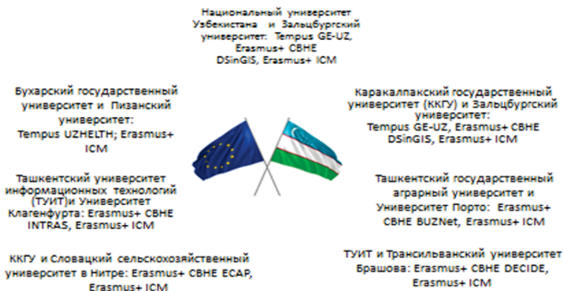
Рисунок 3. Синергия проектов CBHE и ICM